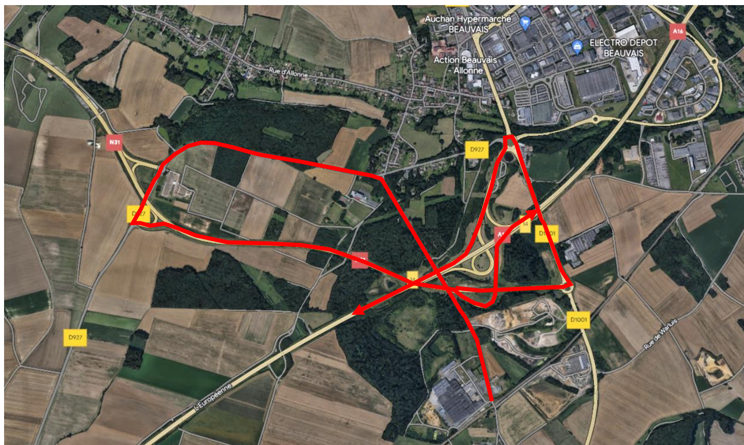
Vue éloignée de la desserte routière de l'établissement

L'autoroute A16 est accessible depuis l'échangeur n°14 (Beauvais Sud) via la Rue de la Gare, la Rue du Bois d'Aumont, la RD 927 puis la RN31.